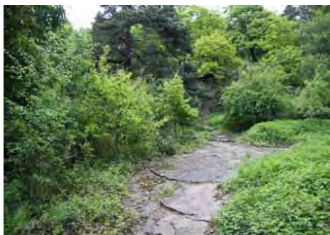
Fig. 2. Granitowa ściana Kamieniołomu Harcerskiego • Granite wall in the “Scout Quarry”

Funkcje nieczynnych kamieniołomów w krajobrazie mogą być różne, jednakże w większości przypadków uzależnione są od fizjografii terenu, a co się z tym wiąże od lokalizacji, rodzaju wydobywanej kopaliny, indywidualnego charakteru oraz od historii wyrobiska. Warto w tym miejscu wspomnieć, że kamieniołomy jako wyrobiska górnicze wchodzi w skład szeroko pojętego dziedzictwa górniczego, a ono na świecie rozpatrywane jest jako dziedzictwo kulturowe i bywa wpisywane na Listę Światowego Dziedzictwa Kulturowego i Przyrodniczego UNESCO (Lorenc, 2010; Lorenc, Janusz, 2010; Lorenc, Cocks, 2008; Pérez Sánchez, Lorenc, 2008).