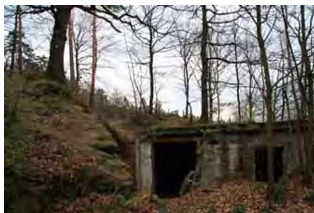
Fig. 4. Ruiny po zabudowie scenicznej amfiteatru • Remains of stage construction in the amphitheatre

W latach 1925–1926, w nieczynnym już od dawna wyrobisku, został wybudowany amfiteatr (Fig. 3), w którym aż do 1945 r. odbywały się liczne spotkania i imprezy plenerowe. Na początku 1945 r. amfiteatr ten został rozebrany przez wojska hitlerowskie na materiał do budowy linii obronnych.