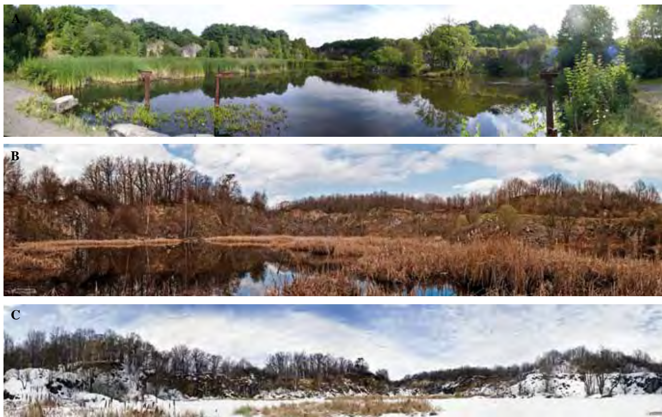
Fig. 3. Stan obecny kamieniołomu bazaltu w Strzegomiu – po rekultywacji wykonanej przez naturę, 3a – fot. K. Skolak, 3b, c – fot. S. Dzieniszewski • Recent state of basalt quarry in Strzegom after natural recultivation, 3a – phot. K. Skolak, 3b, c – phot. S. Dzieniszewski

Często są to tereny gminne, zaś gminy szukając możliwości zwiększenia budżetu, sprzedają takie tereny. W zależności od tego, jakie cele ma nowy inwestor, obszar ten może zostać przekształcony w składowisko odpadów (Fig. 4) lub wykorzystany zgodnie z jego potencjałem, czego przykładem jest dawny kamieniołom wapienia na Malcie (Skoczyła 2008) czy też doskonale zaprojektowane i wykonane, nowe zagospodarowanie kamieniołomu granitu w Hanzenberg w Niemczech (Fig. 5).