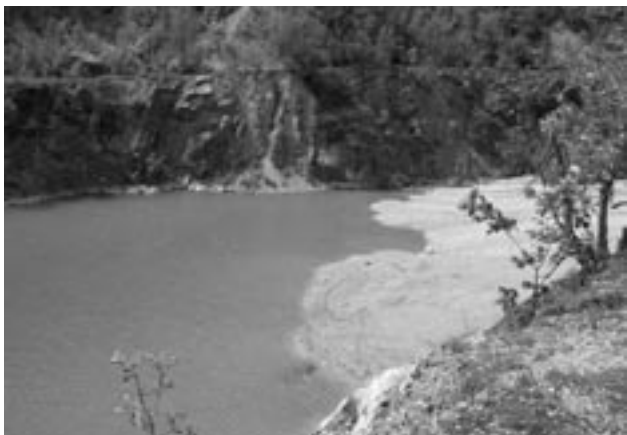
Ryc. 2. Jezioro „Zerówka” w masywie Połomu