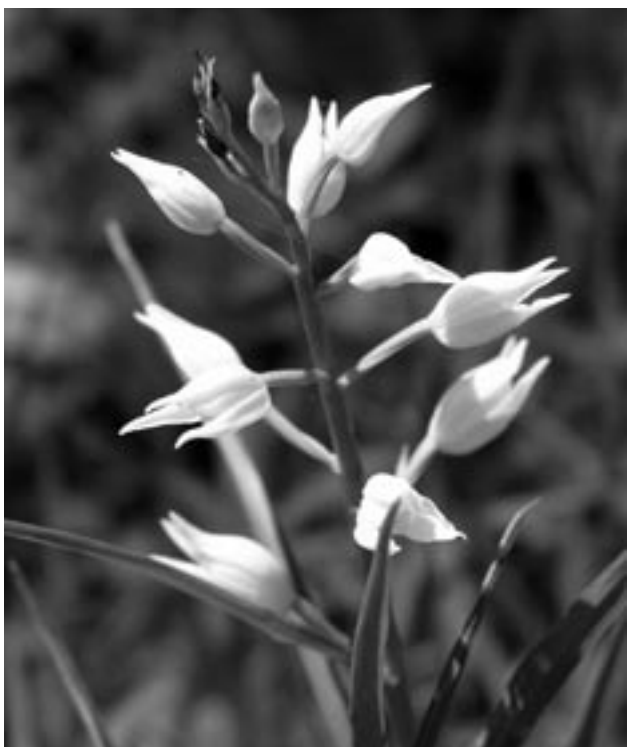
Ryc. 3. Bulawnik mieczolistny ( Cephalanthera longifolia )

Obecnie znanych jest około 20 jaskiń; część z nich na pewno w niedalekiej przyszłości ulegnie zniszczeniu. Zagrożeniem jest zarówno prowadzony na terenie kamie-