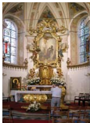
Ząbkowice Śląskie – kościół pw. św. Jadwigi

Najważniejszym obiektem związanym z cystersami jest kościół pw. św. Jadwigi w Sadlnie, dzisiejszej dzielnicy Ząbkowice Śl. Na początku XIII w. Henryk I Brodaty nadał klasztorowi cysterek w Trzebnicy bogate nadania ziemskie, w tym las Sadlno z prawem lokacji