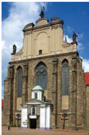
Kościół pw. NMP i św. Jakuba Starszego w Kamięciu Żąbkowickim

Pocysterski kościół pełni dziś funkcję kościoła parafialnego pw. Najświętszej Maryi Panny i św. Jakuba Starszego. Kościół jest orientowaną trójnawową halą z transeptem i wydłużonym prezbiterium, przykrytą sklepieniem krzyżowo-żebrowym. Wystrój kościoła jest barokowy, a na szczególną uwagę zasługuje ołtarz główny, wykonany w 1704 r. Jest to ołtarz wielokondygnacyjny, wykonany z drewna sosnowego, a figury z drewna lipowego. Wystrój tworzą figury 12 apostołów, muzykujące anioły, a na zwieńczeniu postać św. Bernarda. W ołtarzu są dwa obrazy: górny, owalny przedstawiający koronującą Trójcę Świętą i dolny, przedstawiający Wniebowzięcie NMP, wykonane przez Michała Willmanna. Tabernakulum otaczają figury ojców kościoła, świętych: Grzegorza, Hieronima, Ambrożego i Augustyna. Ambona to wybitne dzieło sztuki rzeźbiarskiej autorstwa Krzysztofa Königera z 1708 r. W zwieńczeniu przedstawiona jest scena z odpoczywającym pod drzewem Jakubem, któremu we śnie objawił się Bóg i Aniołowie. Nad baldachimem drabina oparta o chmury, po której wchodzą i schodzą anioły. Wnętrze zdobią liczne barokowe ołtarze boczne. Uzupełnieniem tego bogatego wnętrza są Stacje Drogi Krzyżowej z pocz.