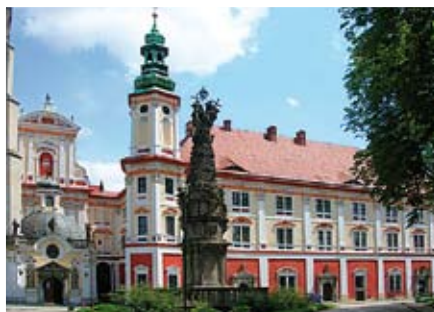
Opactwo Cysterskie w Henrykowie

św. Jan Ewangelista i św. Paweł. W górnym piętrze po lewej stronie rzeźba św. Jadwigi, po prawej jej męża, Henryka I Brodatego. W górnej części nawy głównej zespół 14 barokowych obrazów przedstawiających życie i legendę św. Bernarda. Ambona i ołtarze boczne pochodzą z końca XVII w. Najpiękniejszym obiektem kościoła są barokowe stalle, ukończone ok. 1710 r.