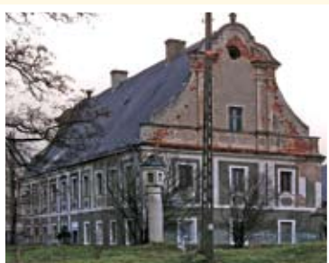
Dzbanów – pocysterski dwór