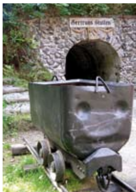
Złoty Stok – Kopalnia Złota

Miasto położone na północnych stokach Gór Złotych, dawny ośrodek górnictwa złota. Średniowieczna osada górnicza Richinstein była wzmiankowana w XIII w. związku z wydobywaniem w okolicy złota, chociaż niektórzy historycy mówią o jej powstaniu już w X w. Pierwsza wzmianka o miejscowości jest zamieszczona w dokumencie księcia Henryka IV