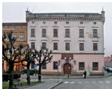
Ziębice – dawny Dwór Opata Tobiasza