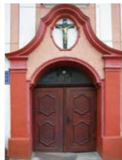
Srebrna Góra – portal zabytkowej plebani

Początki miejscowości są ściśle związane z pobliskim Budzowem i działającymi tam cystersami z Henrykowa. W średniowieczu odkryto tutaj złoża rud metali, w tym srebra. Stało się to impulsem do podjęcia prac górniczych, których początek sięga 1331 r. gdy Bolko II ziębicki sprzedał rycerzowi Cunadowi z Budzowa wzniesienie nazwane Srebrną Górą w celu prowadzenia poszukiwań górniczych. Wzrost wydobycia zaczął się później, bo dopiero w 1454 r. gdy cystersi henrykowscy, będący właścicielami Budzowa, uzyskali przywilej na prowadzenie robót górniczych. Największy rozwój górnictwa nastąpił za rządów Karola I Podiebradowicza w 1. poł. XVI w. i wówczas w 1536 r. osada uzyskała prawa wolnego miasta górniczego. Górnictwo skończyło się z wybuchem wojny trzydziestoletniej, a w latach 1765–1772 zbudowano ponad miasteczkiem potężną twierdzę. Przez długie lata w Srebrnej Górze nie było parafii ani kościoła, a mieszkańcy należeli do parafii w Budzowie. W 2 poł. XVI w. powstał w Srebrnej Górze kościół protestancki, który po wojnie trzydziestoletniej został przekazany katolikom i był