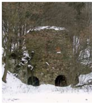
Nowina – piec wapienniczy

Mała wieś na Wzgórzach Strzelińskich o układzie łańcuchówki, położona na wschodnich stokach wzniesienia Buczek (335 m npm). Początki wsi nie są znane. Powstała prawdopodobnie w poł. XIV w. jako własność rycerska. Była własnością kilku rodów śląskiej szlachty aż do 2. poł. XVIII w., kiedy to około 1680 r. ówczesny właściciel baron Żerotin, sprzedał ją klasztorowi henrykowskiemu. W 1785 r. w Nowinie mieszkało 3 kmieci, 16 zagrodników i 6 chałupników, był folwark klasztorny, młyn i 2 budynki gminne. W wyniku kasaty klasztoru i jego dóbr, właścicielką ich została Luiza Wilhelmina Orańska a potem jej spadkobiercy. Spośród zabudowy wsi wyróżnia się nieco zrujnowany, zespół dawnego folwarku pocysterskiego, przebudowany w I poł. XIX w. z budynkiem mieszkalnym i budynkami gospodarczymi. Powyżej wsi pod lasem znajduje się opuszczony dawny piec wapienniczy, zbudowany w 1797 r. z polecenia opata Marka z Henrykowa.