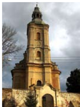
Topola – kościół parafialny pw. św. Bartłomieja

Wieś o charakterze ulicówki położona w Pradolinie Nysy Kłodzkiej na prawym brzegu rzeki. Od wschodniej strony graniczy ze zbiornikiem wodnym Topola. Topola jest starą osadą powstałą w 2. poł. XIII w., związaną od początku z dobrami w Byczeniu. Początkowo była własnością rycerską a od 1353 r. stała się własnością klasztoru cystersów w Kamieńcu. Podczas wojny trzydziestoletniej w 1645 r. miejscowość została doszczętnie zniszczona, a jej mieszkańcy opuścili wieś na 4 lata. Do 1810 r. była wsią klasztorną. We wsi znajduje się pocysterski kościół parafialny pw. św. Bartłomieja, wzmiankowany już w 1317 r. Obecny barokowy powstał w tym miejscu w latach 1754–1757 i jest fundacją opata Tobiasza Stusche, pochodzącego z Topoli. Wnętrze kościoła jest w stylu barokowym i rokokowym, pochodzi