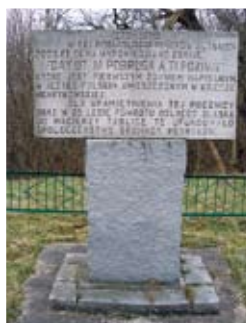
Pomnik Księgi Henrykowskiej

Jedna z najstarszych wsi w rejonie Henrykowa, założona prawdopodobnie przed 1201 r., jako własność niejakiego Boguchwała, rycerza księcia Bolesława I Wysokiego, który być może był pochodzenia czeskiego. Wieś opisana w Księdze Henrykowskiej, gdzie znajduje się etymologia jej nazwy.