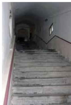
Srebrna Góra – schody prowadzące do kościoła