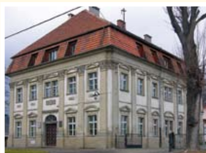
Budzów – dawna kuria henrykowska

Stara wieś o charakterze łańcuchówki leżąca w Obnizeniu Stoszowic na Przedgórzu Sudeckim w szerokiej dolinie Srebrnego Potoku, jedna z najdłuższych wsi na Dolnym Śląsku. Miejscowość wymieniona w Księdze Henrykowskiej, o której pierwsza wzmianka pochodzi z 1221 r. W 1228 r. książę Henryk I Brodaty nadał cystersom 50 łanów wielkich lasu Budzyny w pobliżu dzisiejszego Budzowa, a jego syn, książę Henryk II Pobożny w 1240 r. zezwolił cystersom na założenie wsi na prawie niemieckim, która jednak nie została założona na skutek najazdu mongolskiego na Śląsk w 1241 r. Po najeździe tereny te przejął bezprawnie komes Piotr Stoszowic, zakładając tam wieś Budzów. Tereny zostały odzyskane przez opactwo henrykowskie w 1244 r. W 1339 r. książę ziębicki Bolko II przekazał opactwu henrykowskiemu