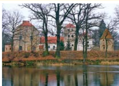
Witostowice – zamek nawodny

W górnej części wsi – Zakrzowie znajdują się dwa wczesnośredniowieczne grodziska oraz ślady działającej tutaj w latach 20. XX w. kopalni grafitu.