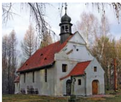
Muszkowice – kaplica pw. św. Anny

tutaj folwark, młyn wodny, dom gminny, mieszkało 2 kmieci, 14 zagrodników i 41 chałupników. Na Kaplicznym Wzgórzu w Lesie Bukowym znajduje się barokowa kaplica św. Anny z 1707 r., zbudowana przez cystersów z Henrykowa. Na początku XIX w. wybudowano