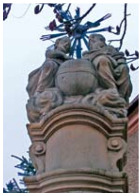
Starczów – pomnik. Świętej Trójcy

się własnością księżnej Fryderyki Luizy Wilhelminy Hohenzollern, a później drogą spadku przypadła jej córce Mariannie Wilhelminie Orańskiej. We wsi zachowały się stare domy, wśród których na uwagę zasługuje budynek położony w jej środkowej części, dawny dwór