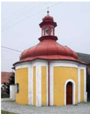
Jaworek – kaplica pw. św. Michała

Z nazwy wsi można wnosić o jej słowiańskim pochodzeniu od polskiego słowa „javor”. Ponownie nazwa wsi pojawia się w dokumencie z 1260 r., już jako villa Henrici (wieś Henryka), w późniejszym okresie w zmienionej formie jako Hammersdorf, w końcu jako Heinersdorf. W 1267 r. papież Klemens IV potwierdza prawa do wsi klasztorowi trzebnickiemu. W 1335 r. istnieje informacja o kaplicy w Jaworku. Wieś nigdy nie była siedzibą parafii, podlegała w tym względzie, podobnie jak dzisiaj, parafii św. Jadwigi w Sadlnie. Podczas