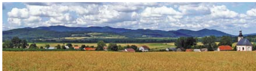
Sosnowa – wieś łańcuchowa z widocznym kościołem pw. Św. Maternusa

Wieś łańcuchowa w dolinie rzeczki Świdły na terenie Przedgórza Paczkowskiego. Została założona na pocz. XIII w. jako wieś książęca i była wsią słowiańską. Pierwsza o niej wzmianka pochodzi z 1210 r. i występuje jako nadanie klasztorowi augustianów w Kamieńcu Ząbkowickim. W 1251 r. stała się własnością cystersów, ale przez okres 100 lat