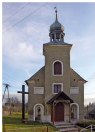
Piotrowice Polskie – kościół pw. Matki Boskiej Bolesnej

Niewielka wieś na Wzgórzach Dobrzeńskich w dolinie Zamecznego Potoku na skraju Lasu Bukowego. Teren w pobliżu Piotrowic Polskich w Lesie Bukowym to jeden z obszarów najstarszego osadnictwa na Dolnym Śląsku. W lesie znajdują się 4 zgrupowania około 30 kurhanów z epoki brązu, wpływów rzymskich, kultury lużyckiej a także okresu wczesnośredniowiecznego. Pierwsza wzmianka o wsi pochodzi z 1228 r. Do końca XIV w. była własnością rycerską, a od 1398 r. do 1810 r. klasztoru cystersów w Henrykowie. W 1785 r. zanotowano, że we wsi był kościół, folwark, dom gminny, kuźnia, mieszkało 12 kmieci, 4 zagrodników i 31 chałupników. We wsi musieli jeszcze w XVII w. mieszkać Polacy, o czym świadczy nazwa Piotrowice Polskie, zniesiona dopiero w latach 30. XX w. Z zabytków zachował się skromny późnobarokowy kościół pw. Matki Boskiej Bolesnej z 1795 r. Jest to niewielka, jednonawowa budowla z wejściem od strony wieży. Wewnątrz późnobarokowy polichromowany ołtarz główny z końca XVIII w. oraz parę figur z tego okresu. Wśród obiektów gospodarczych zachowała się kuźnia z końca XVIII w., przebudowana w poł. XIX w.