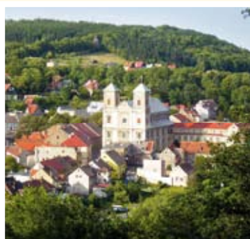
Kościół pw. Nawiedzenia NMP w Bardzie

Barokowa ambona pochodzi z 1698 r. Wyjątkowym elementem w wystroju kościoła są barokowe organy, które liczą 50 głosów i 3567 piszczałek. Rokokowa dekoracja in-