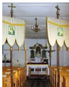
Skalice – kaplica mszalna pw. św. Wawrzyńca