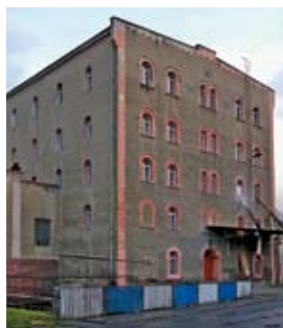
Przylęk – młyn wodny

Jest to duża wieś leżąca na wschód od Barda w dolinie Nysy Kłodzkiej w miejscu, gdzie kończy się jej przełom przez Góry Bardzkie. Jej słowiańskie początki sięgają XI–XII w., kiedy to w tym miejscu istniała już wieś o nazwie Prilanc, wymieniona po raz pierwszy w 1189 r.