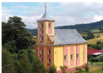
Chwalisław – kościół pw. św. Jakuba Apostoła

Duża wieś łańcuchowa położona nad Mąkolnicą w Górach Złotych u podnóża Ptasznika (719 m n.p.m.). Wieś, podobnie jak inne leżące w pobliżu Złotego Stoku, powstała ok. 1260 r. jako wieś cysterska i pozostawała nią aż do sekularyzacji w 1810 r. W 1782 r.