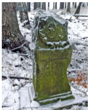
Jemna – Kamień Trzech Granic

Jemna to wieś leżąca w części w Górach Sowich i na Przedgórzu Sudeckim w Obniżeniu Stoszowic, która niegdyś składała się z dwóch oddzielnych wsi (niem. Raschgrund i Raschdorf) oraz dwóch kolonii. Powstała prawdopodobnie w pocz. XIV w. Do rozwoju wsi przyczyniły się roboty górnicze w sąsiedniej Srebrnej Górze. W 1406 r. cystersi z Henrykowa założyli wieś Radziszyn (niem. Raschgrund), która znajdowała się w dolinie Chyżego Potoku, którą klasztor założył jako osadę tkaczy i utrzymał w posiadaniu z przerwami do 1810 r. (to dzisiaj górna część wsi). W 1419 r. rejon dzisiejszej Jemnej (dolna część) otrzymał jako nadanie klasztor cystersów w Kamieńcu Żąbkowickim. Część wsi była w tym czasie także własnością rodziny von Haugwitz. W 1787 r. był tutaj folwark, młyn wodny, mieszkało 8 kmieci, 13 zagrodników i 11 chałupników.