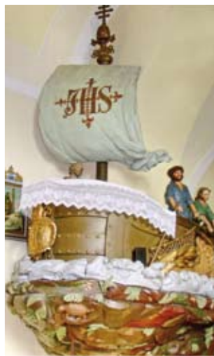
Sieroszów – ambona łodziowa