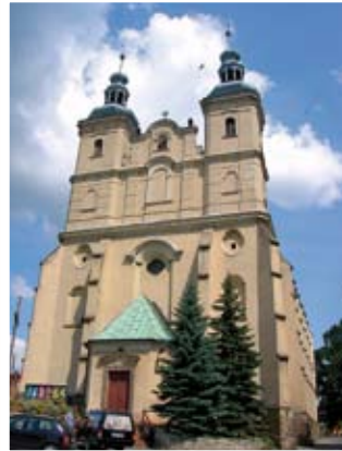
Bobolice – kościół pw. Matki Boskiej Bolesnej

należał do parafii w Zwróconej. Niestety w późniejszym czasie nie udało się dokończyć budowy kościoła, a od połowy XVI w. aż do 1648 r. kościół w Bobolicach znajdował się w rękach protestantów. Aby zapobiec profanacji, figurka Matki Boskiej Bolesnej była prze-