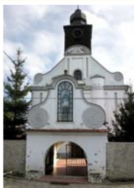
Bożnowice – kościół parafialny pw. Świętej Trójcy