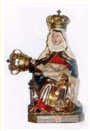
Bobolice – figura Matki Boskiej Bolesnej