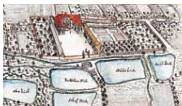
Błotnica – rycina F. B. Wenera

Niewielka wieś leżąca na skraju Przedgórza Paczkowskiego i Pradoliny Nysy Kłodzkiej nad strumykiem Pusta. Pierwsza wzmianka o wsi pochodzi z 1293 r. i występuje w niej nazwa „Blothnicza”. Nazwa pochodzi zapewne od podmokłych terenów leśnych, leżących na północnych krańcach wsi. Założenie Błotnicy i jej początki są słabo rozpoznane. Przypisuje się jej działalność osadniczą klasztoru cystersów w Kamieńcu Ząbkowickim, który około 1260 r. zakładał wsie na terenie Przesieki Sudeckiej.