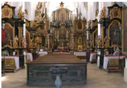
Wnętrze kościoła w Henrykowie

Wczesnogotycki, zbudowany w latach 1241–1270 i w 1. poł. XIV w., z dwoma gotyckimi kaplicami tworzącymi kościółek św. Krzyża z 1. poł. XVI w. oraz trzema barokowymi kaplicami z poł. XVIII w. W kaplicy św. Marii Magdaleny z 1760 r. znajduje się Mauzoleum Piastów Ziębińskich. Wieża kościoła pochodzi z 1608, fasada kościoła barokowa (1687–1698) z kruchtą z 1713 r. Wnętrze kościoła gotyckie, zbarokizowane. Ołtarz główny (1681–1684) zdobią dwa obrazy Michała Willmanna: „Boże narodzenie w wizji św. Bernarda” oraz górny: „Zbawca świata”. Wielki obraz otaczają rzeźby, od lewej: św. Benedykt, św. Jan Chrzyciel, św. Piotr oraz z drugiej strony, od środka: św. Bernard,