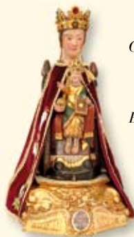
Cudowna figurka Matki Bożej Bardzkiej

Od strony południowej do kościoła przylega barokowy budynek klasztorny w kształcie litery T, wybudowany w miejscu starszego w latach 1712–1716. Wewnątrz ciekawe Muzeum Sakralne. Na dziedzińcu klasztornym stoi piękny pomnik papieża Polaka, Jana Pawła II, wykonany w 1981 r.