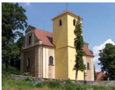
Laski – kościół pw. Wniebowzięcia NMP