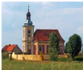
Płonica – kościół pw. ś w. Mikołaja