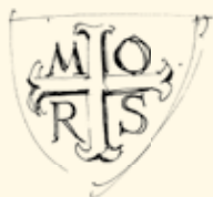
Krzyż morimondzki – herb opactwa macierzystego

Cystersi (Sacer Ordo Cisterciensis – SOCist) to wspólnota zakonna wywodząca się z zakonu benedyktyńskiego, nawiązująca do pierwotnej reguły św. Benedykta z Nursji, powstała w końcu XI w. we Francji. Założycielem cystersów był św. Robert, opat klasztoru benedyktynów z Molesmes, który razem z grupą 21 zakonników osiadł w miejscowości Dijon, tworząc nowy klasztor, który od 1098 r. został podniesiony do rangi opactwa, nazwany potem Cîteaux, łac. Cistercium, stąd nazwa zakonu. Współzałożycielami zakonu cystersów byli dwaj kolejni opaci Cîteaux: św. Alberyk i św. Stefan Harding. Ustalono wówczas regułę oraz strój zakonny, którym stał się biały lub szary habit z czarnym szkaplerzem, który miał chronić habit przed zabrudzeniem. Główną regułą cysterską, która była na początku rygorystycznie przestrzegana była zasada ora et labora – módl się i pracuj . Powołano też nową, nieznaną dotąd instytucję świeckich braci zakonnych – konwersów, którzy nie składali ślubów, nosili szare habit i zajmowali się pracą w klasztorze i poza jego terenem.