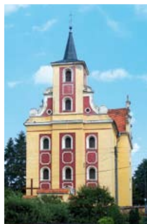
Mąkolno – kościół pw. św. Marii Magdaleny