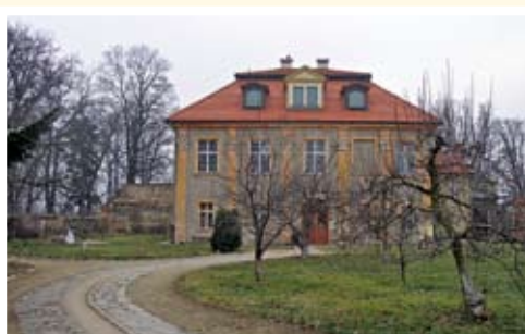
Ząbkowice Śląskie - dawny Dwór Opatów Henrykowskich

Najważniejszym obiektem związanym z cystersami jest kościół pw. św. Jadwigi w Sadlnie, dzisiejszej dzielnicy Ząbkowice Śl. Na początku XIII w. Henryk I Brodaty nadał klasztorowi cysterek w Trzebnicy bogate nadania ziemskie, w tym las Sadlno z prawem lokacji