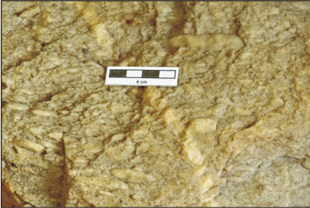
Fig. 2. Fotografia kwarcytu daktylowego.