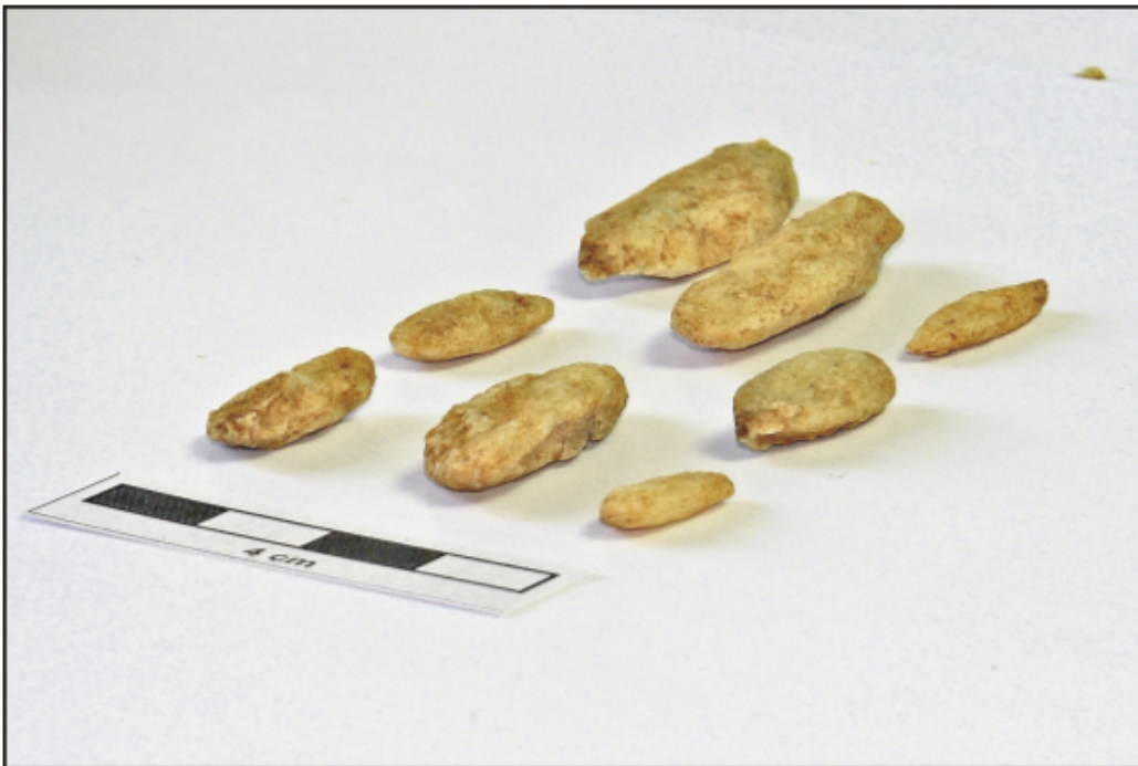
Fig. 3. Fotografia wypreparowanych „daktyli”.