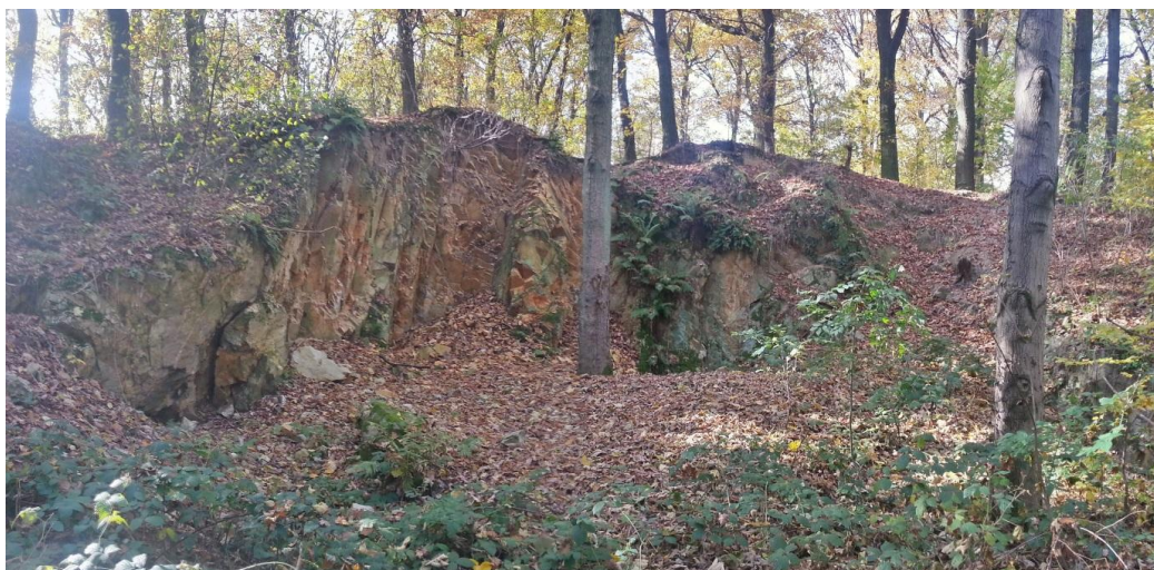
Fig. 1. Ogólne zdjęcie kamieniołomu.