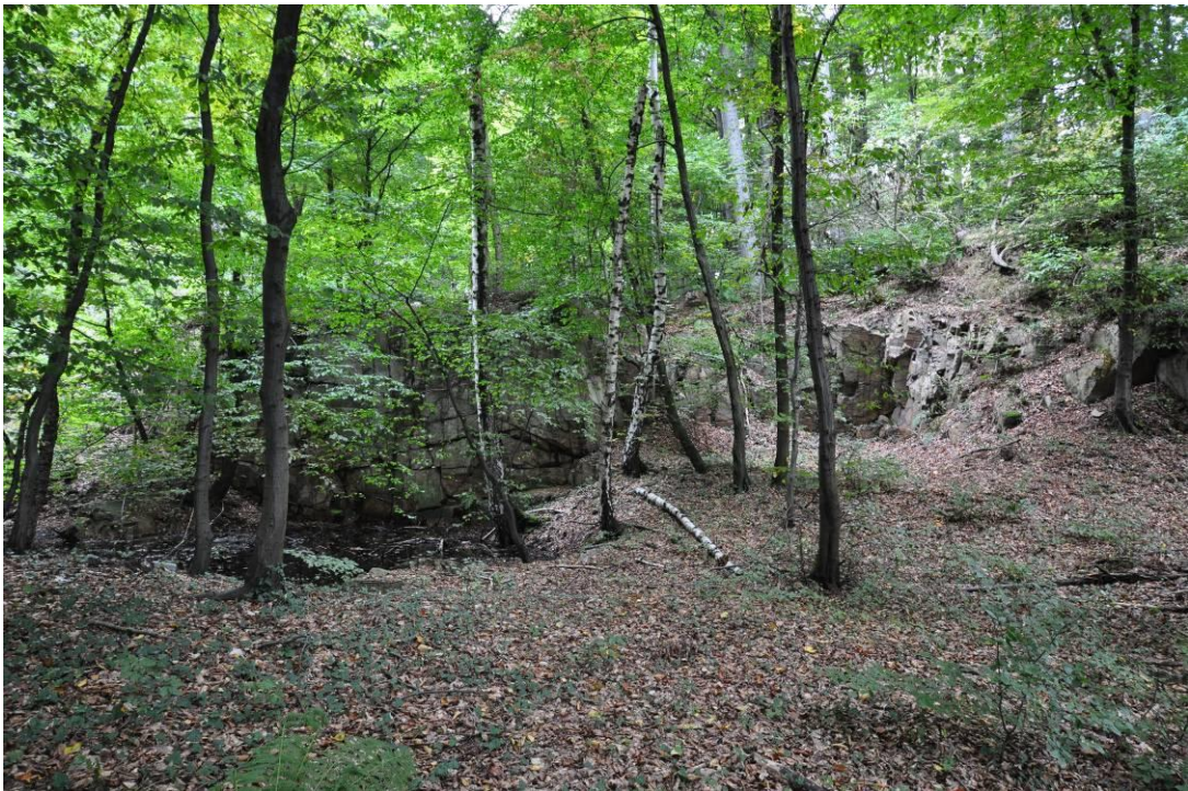
3. Nowoleska Kopa. Widok na kamieniołom.