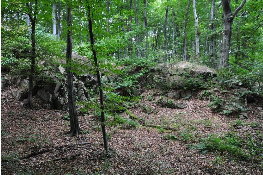
4. Nowoleska Kopa. Widok na kamieniołom.