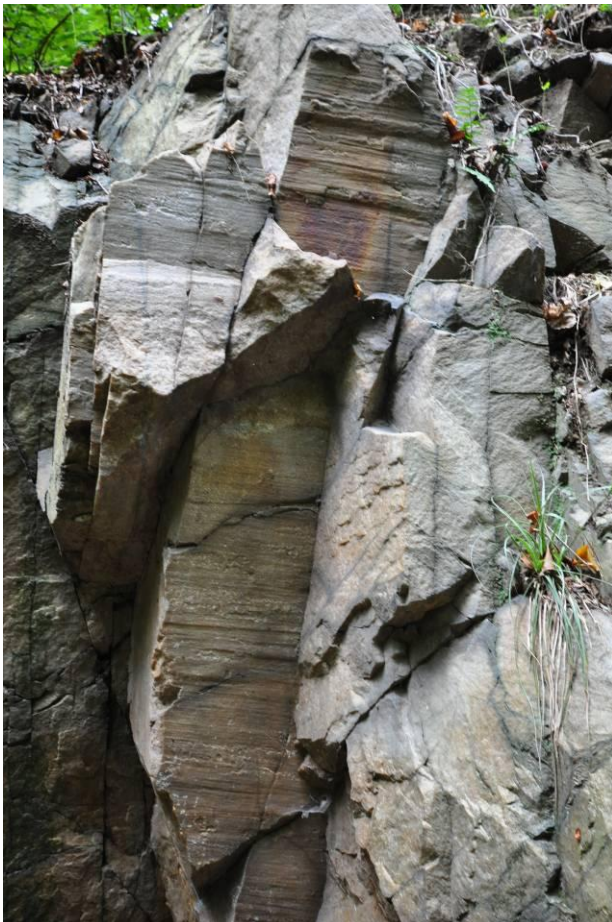
5. Nowoleska Kopa. Kwarcyt.