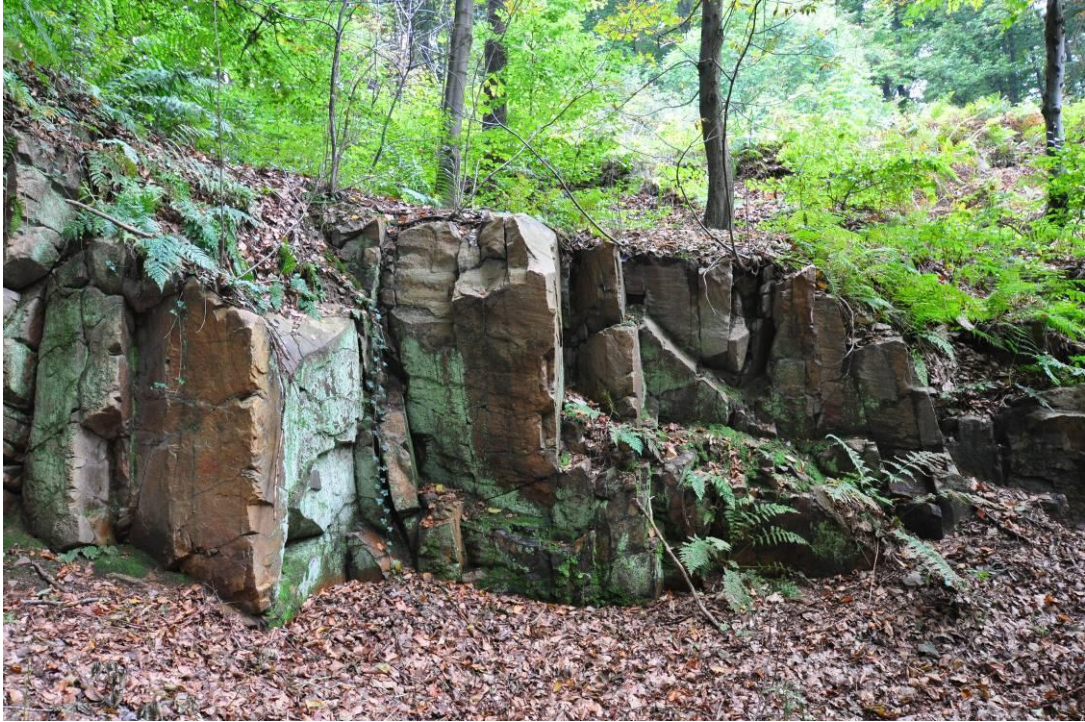
2. Nowoleska Kopa. Kamieniołom.