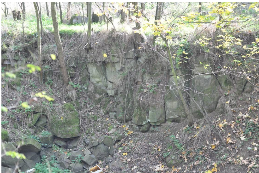
Ryc. 1. Bazalt nefelinowy ze słabo zaznaczoną oddzielnością słupową.