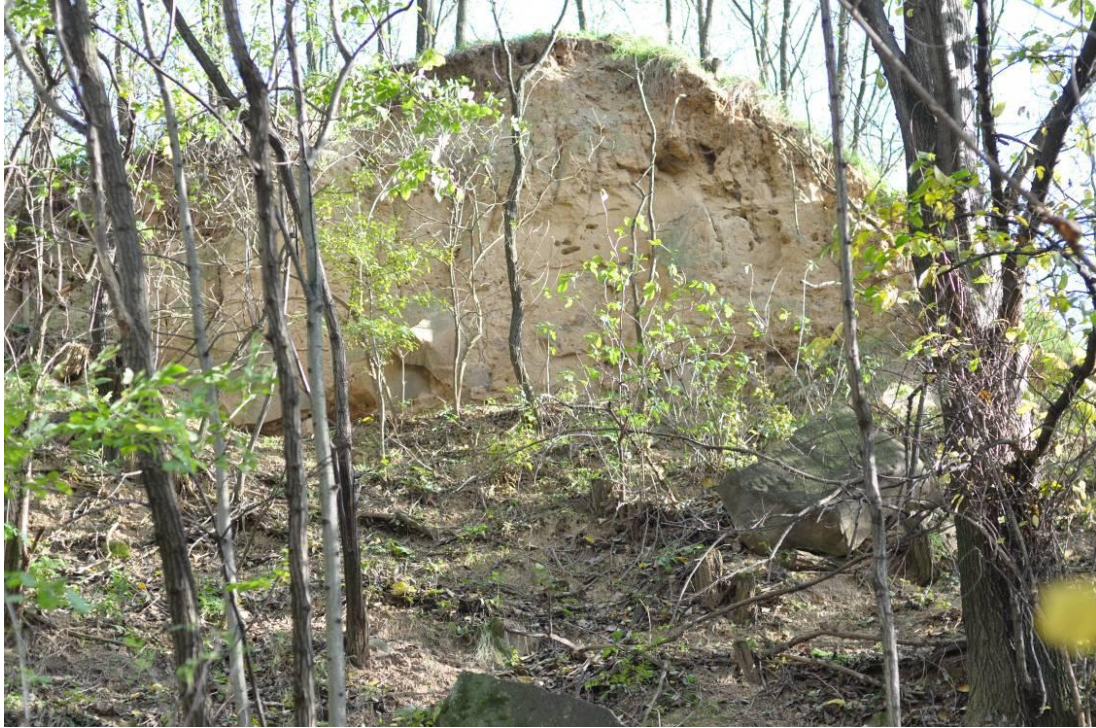
Ryc. 4. Gлина zwietrzelinowa rozwinięta na bazalcie.