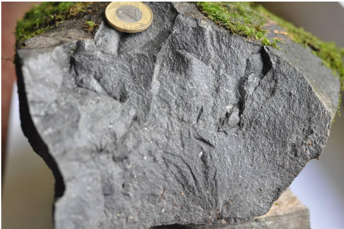
Ryc. 5. Próbkа bazaltu nefelinowego z Kowalskich.