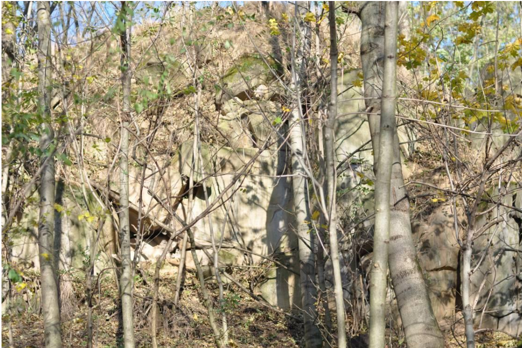
Ryc. 3. Fragment ściany kamieniołomu z widoczną granicą pomiędzy bazaltem nefelinowym a zwierzelnią skalną powstałą w głównej mierze jego kosztem.