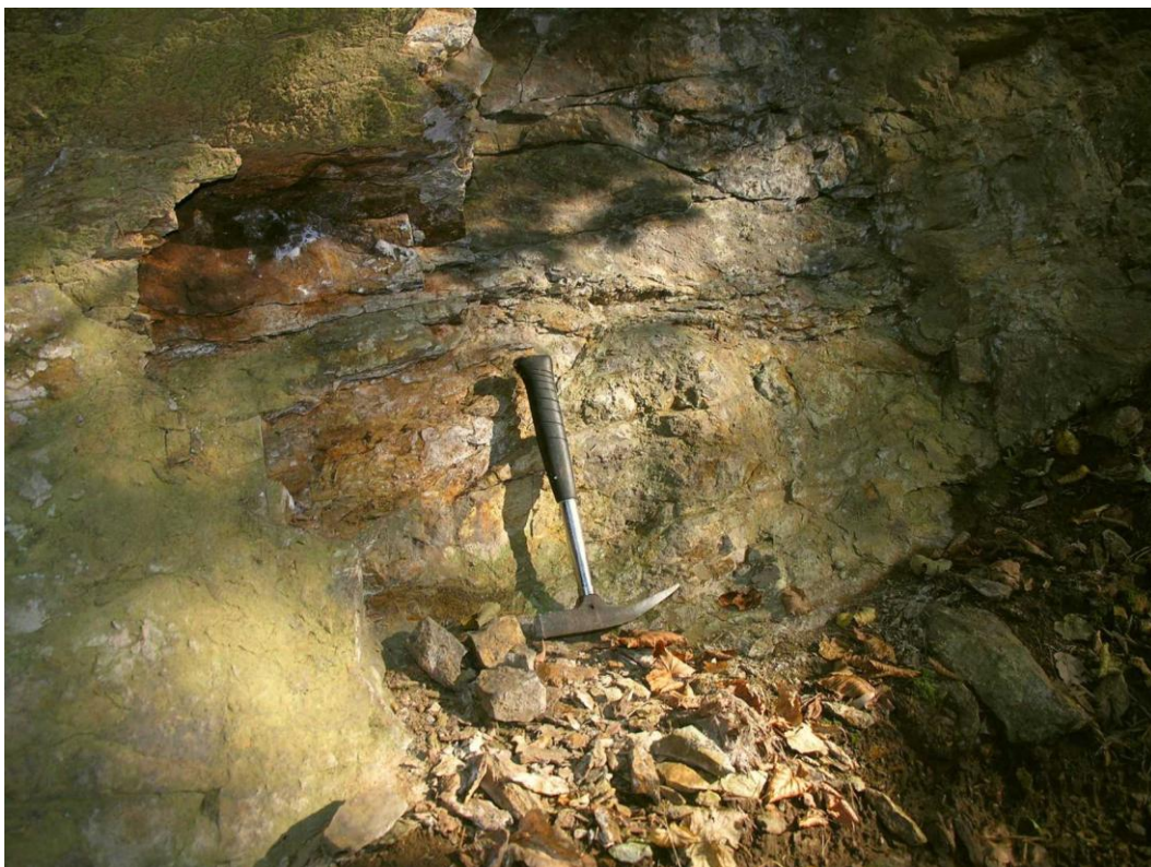
Fot. 2. Fragment ściany północnej kamieniołomu na Rokitkach