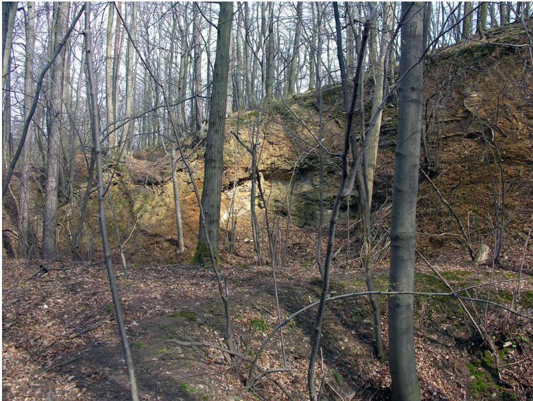
Fot. 1. Widok ściany północnej kamieniołomu na Rokitkach.