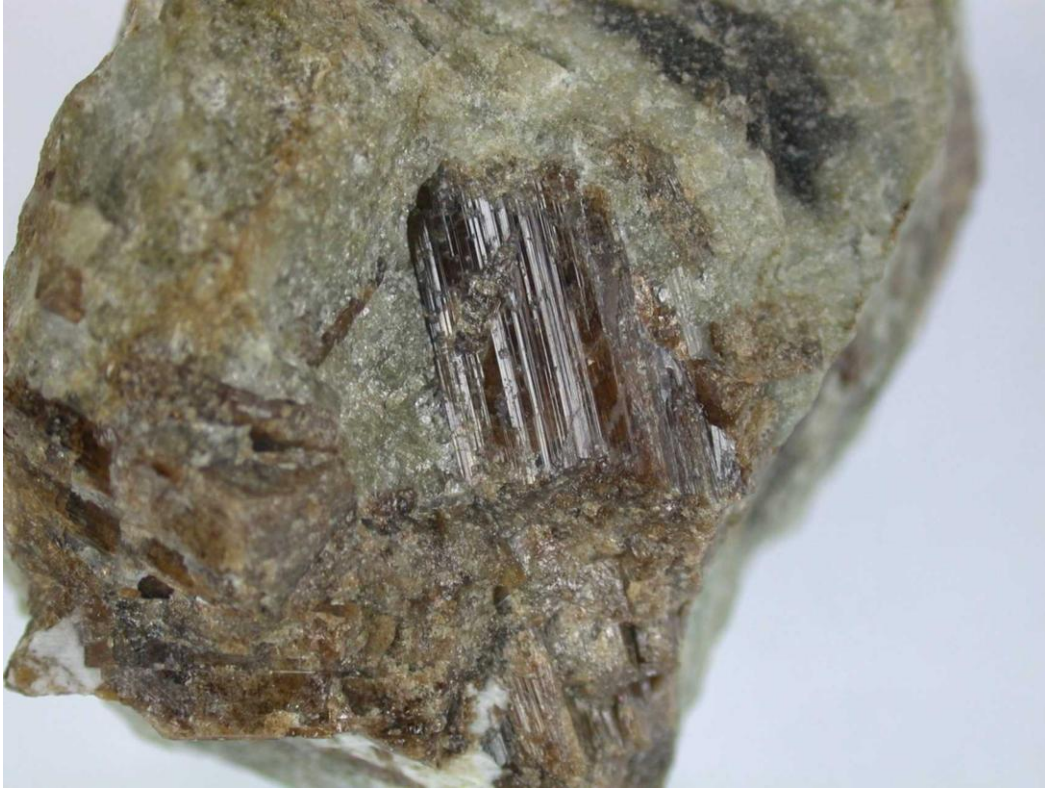
Fot. 5. Mineral wezuwian ze skał wapińsko-krzemianowych z kamieniołomu na Rokitkach.