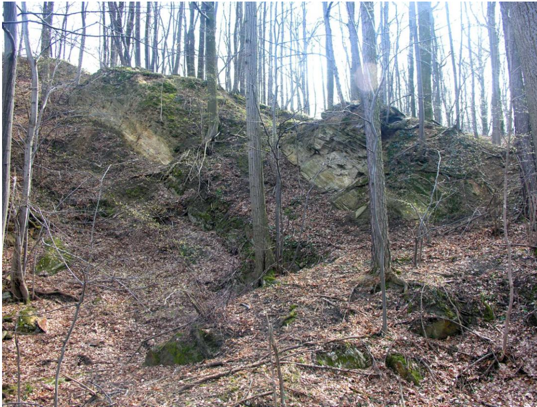
Fot. 3. Widok ściany wschodniej kamieniołomu na Rokitkach.