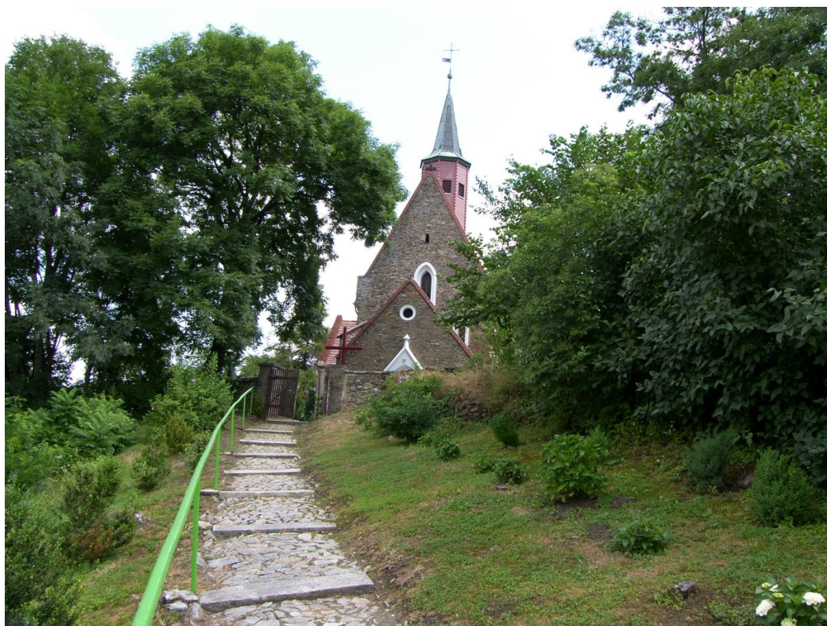
Rysunek 2. Granitowa ścieżka prowadząca do kościoła.