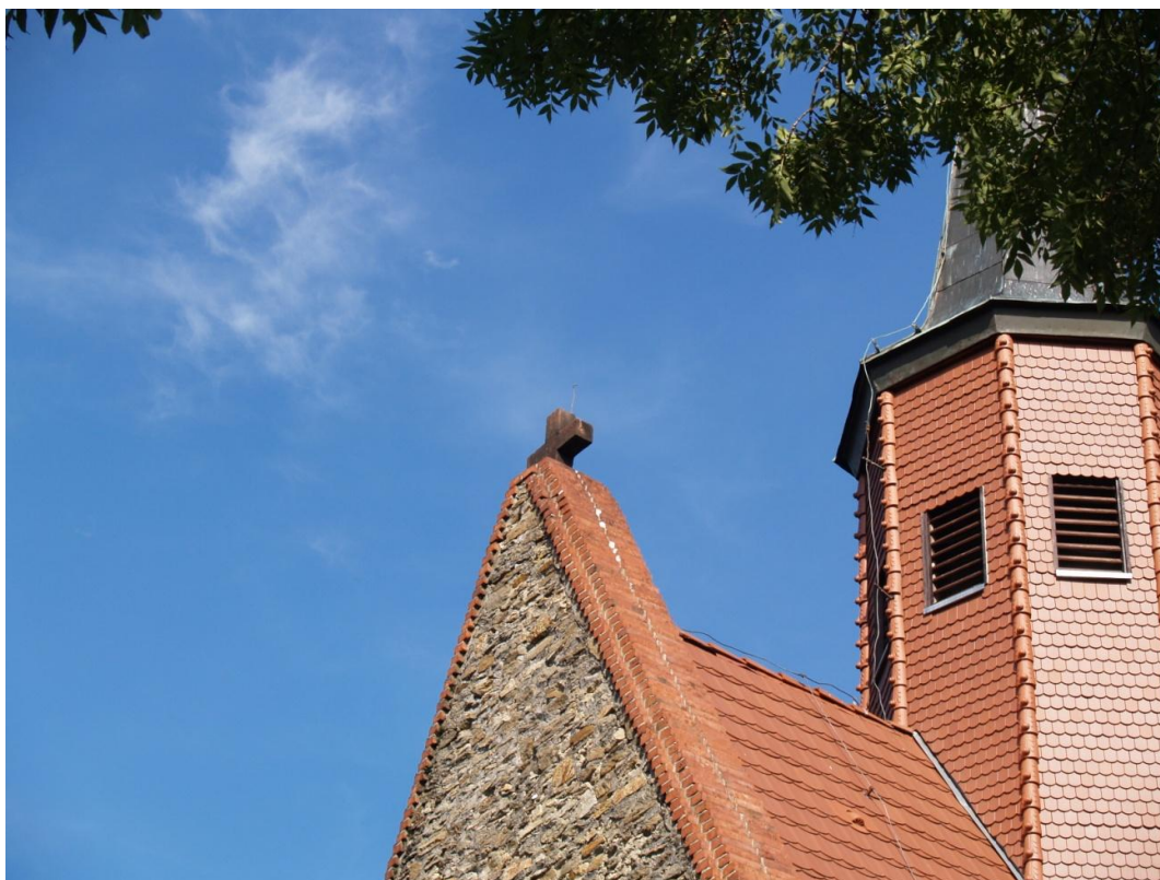
Rysunek 5. Wykonany z czerwonego piaskowca, krzyż wieńczący ścianę szczytową.