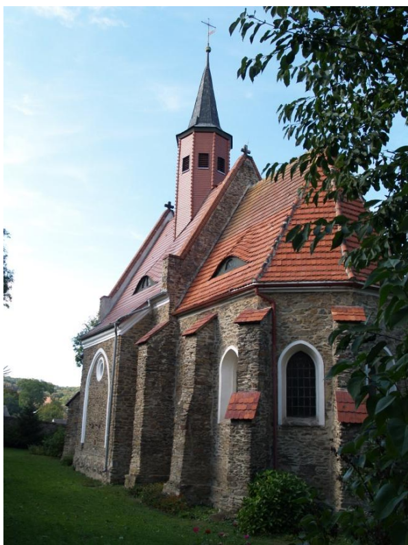
Rysunek 3. Kościół filialny św. Jana Kantego w Nieszkowicach - widok ogólny