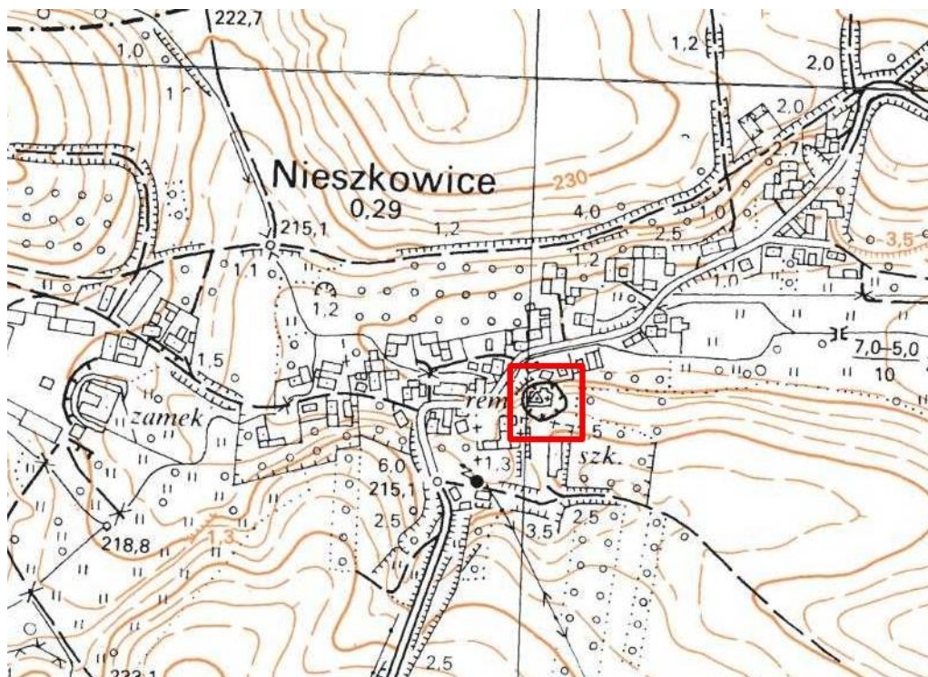
Rysunek 1. Kościół filialny św. Jana Kantego w Nieszkowicach