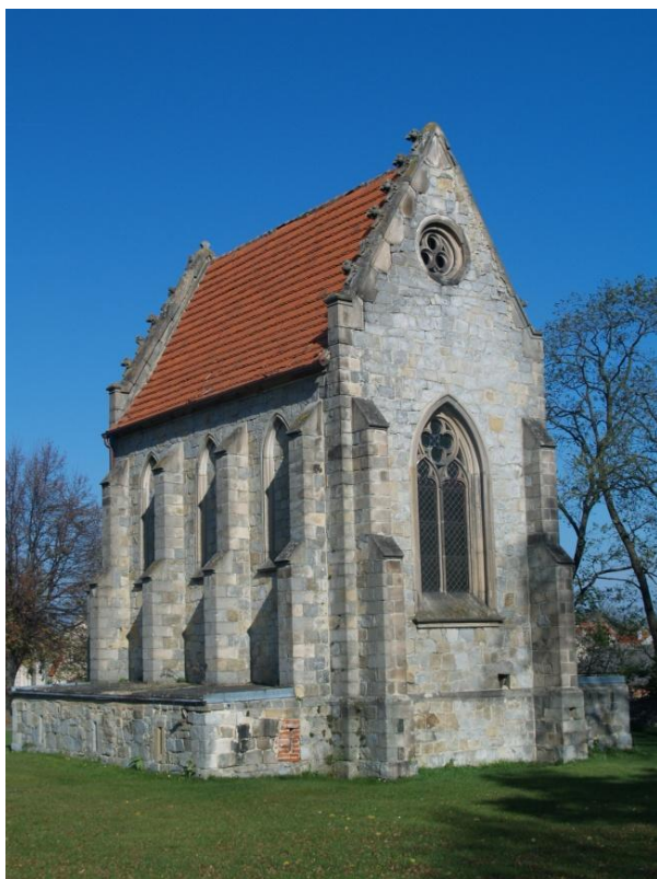
Rysunek 6. Neogotyckie mauzoleum z 2 poł. XIX w. (obecnie kaplica cmentarna).