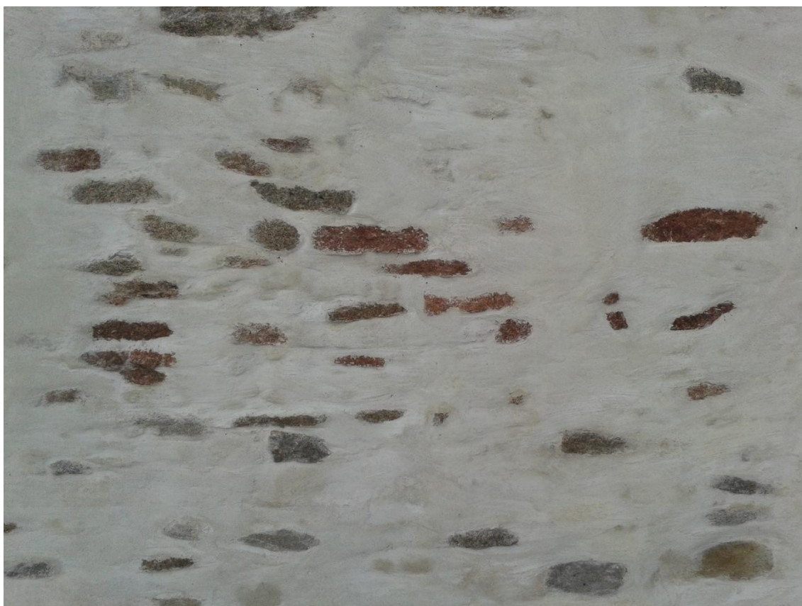
Rysunek 5. Ściana kościoła wykonana z kamienia łamanego, z fragmentami granitu odbarwionego na różowo w wyniku pożaru.