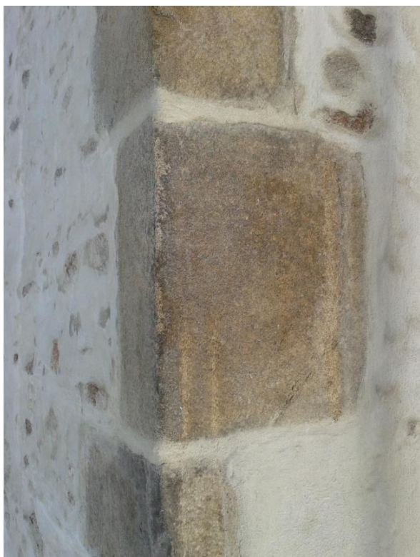
Rysunek 3. Narożnik ściany kościoła wykonany z ciosanego granitu.