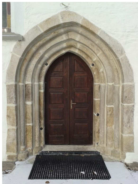
Rysunek 4. Portal w ścianie prezbiterium