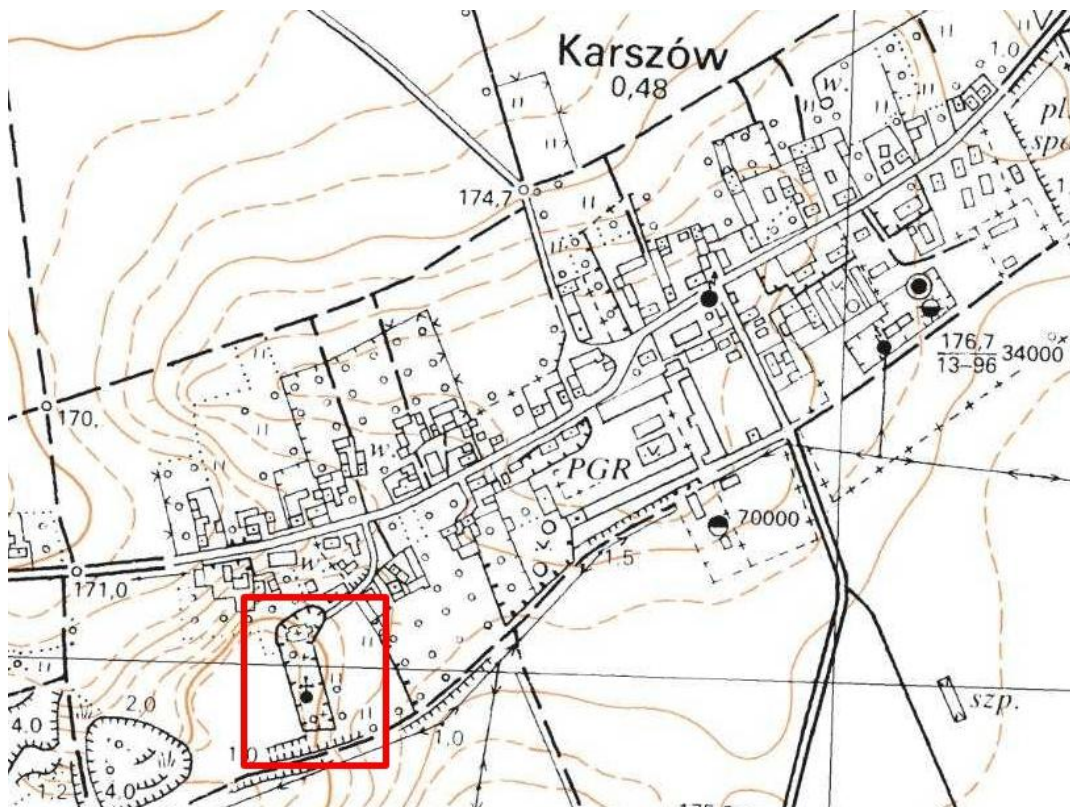
Rysunek 1. Kościół filialny Niepokalanego Poczęcia Najświętszej Marii Panny w Karszowie z kaplicą cmentarną.