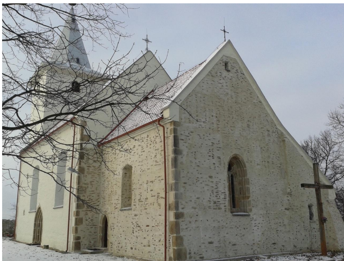
Rysunek 2. Kościół filialny Niepokalanego Poczęcia Najświętszej Marii Panny w Karszowie - widok ogólny